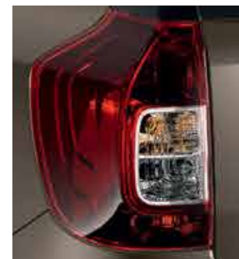
Blocuri optice redesenat