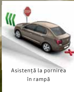
Asistență la pornirea în rampă