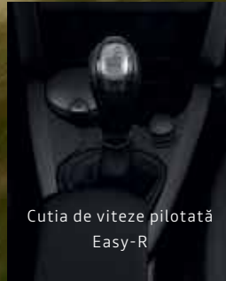
Cutia de viteze pilotată Easy-R

Cu Logan MCV, poți ține sub control consumul de combustibil cu ajutorul unor funcții automate, precum Gear Shift Indicator, care îți afișează momentul oportun pentru schimbarea optimă a treptelor de viteză. Iar sistemul Eco-Mode, odată activat, gestionează în mod inteligent resursele motorului pentru mai multă eficiență.