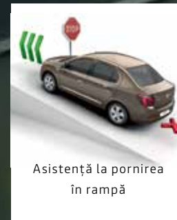
Asistență la pornirea în rampă