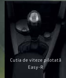
Cutia de viteze pilotată Easy-R