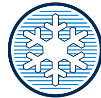
AER CONDIȚIONAT AUTOMAT