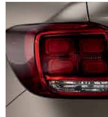
Blocuri optice redesenat