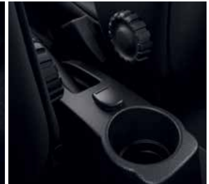
Priză de 12V