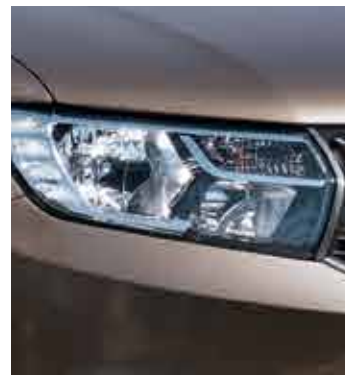
Lumini de zi LED

Dacia Sandero este disponibil în patru niveluri diferite de echipare – Acces, Ambiance, Laureate și vârful de gama Prestige, iar gama de accesorii variată îți permite să-ți personalizezi mașina în funcție de preferințele tale.