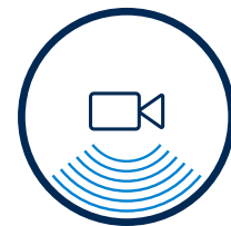
ASISTENȚĂ VIDEO LA PARCARE